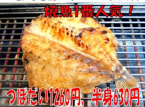
つぼだい1260円、半身630円