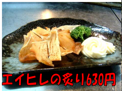
エイヒシの炙り630円