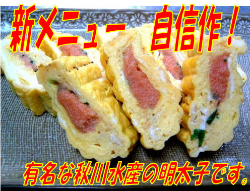
有名な秋川水産の明太子です。 明太子卵焼き (めんたま) 735円