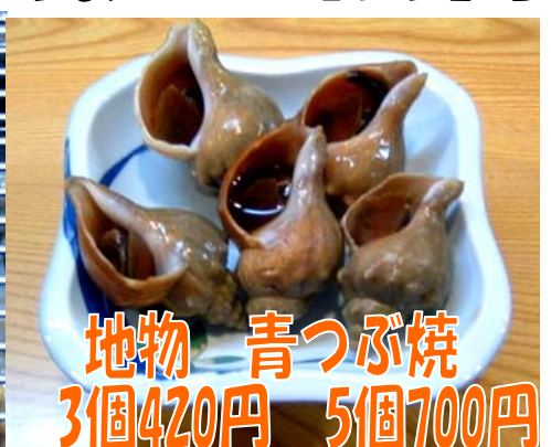
地物 青つぶ焼 3個420円 5個700円