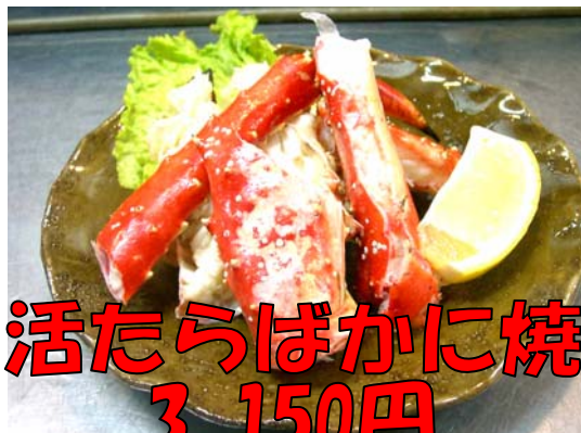
活たらばかに焼 3,150円